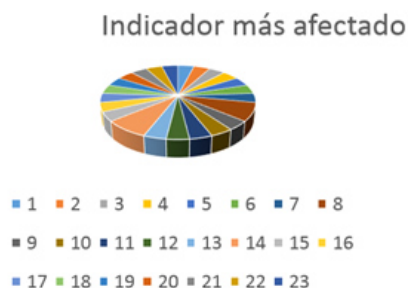
Fig. 2. Comportamiento de los docentes según el aprovechamiento del contexto sociolaboral en función de potenciar la cultura laboral en sus estudiantes. Sede "Félix Varela Morales". Enero 2017.