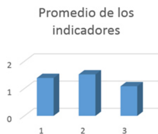
Fig. 1. Aprovechamiento del contexto sociolaboral en función de potenciar la cultura laboral. Sede "Félix Varela Morales". Enero 2017.

El 100 % de los encuestados refieren que no se aprovecha el contexto sociolaboral en función de la cultura laboral, argumentan en la parte final del instrumento que los profesores que imparten la superación profesional poseen insuficiente información científica actualizada acerca de los centros de producción y servicios, las instituciones, empresas y escuelas a los que tributa su labor pedagógica.