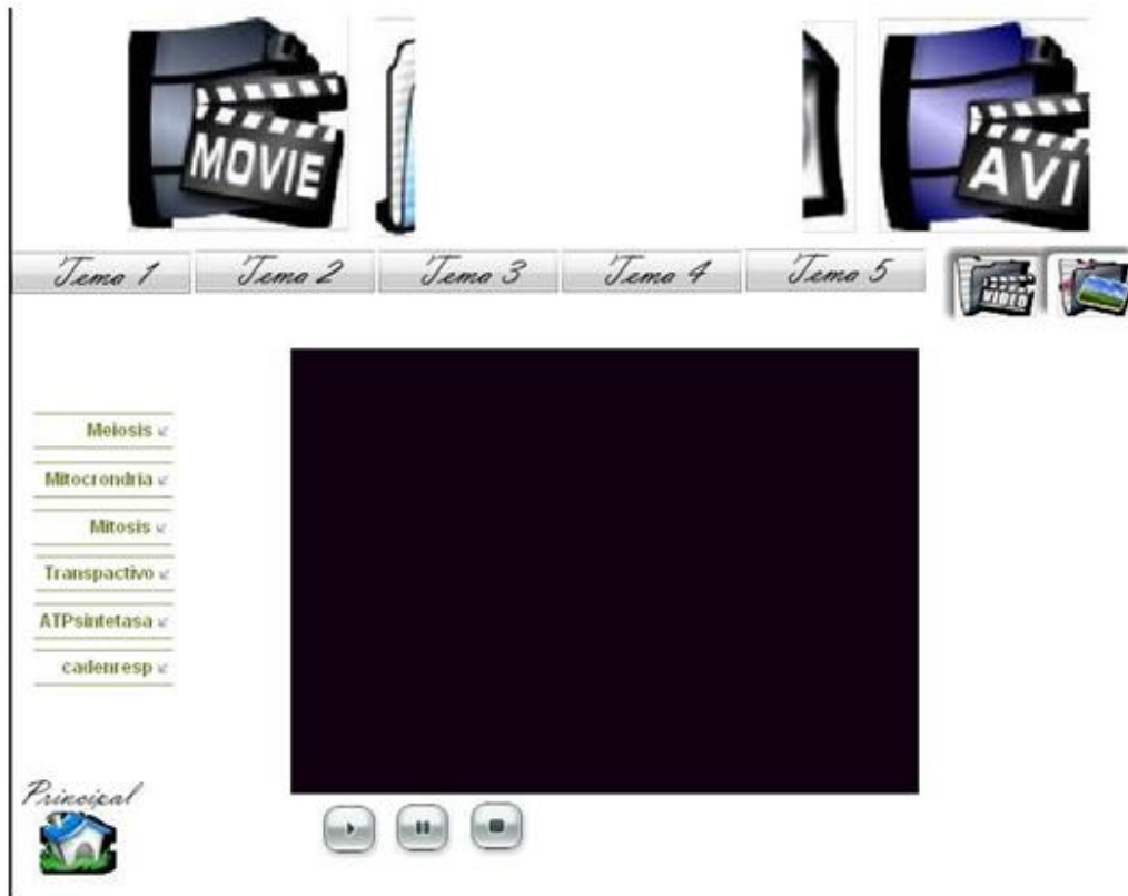
Fig. 4. Página de Videos

Los autores consideran oportuno incorporar a la Multimedia la opción que posibilite que para cada contenido propuesto exista la forma interactiva en el trabajo independiente de los estudiantes.