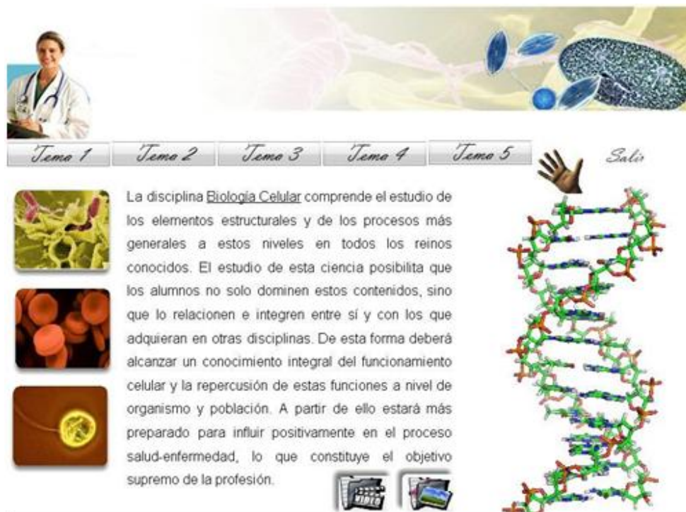
Fig. 2. Página Principal

· Página de imágenes ( Figura 3 ). Al lado izquierdo de la página se encuentran imágenes que aparecen en el centro de forma ampliada, al situar el Mouse encima, y en la parte inferior hay un botón que posibilita la visualización de otras, luego aparecerá un segundo botón para retroceder a la sesión de imágenes anterior si es necesario.