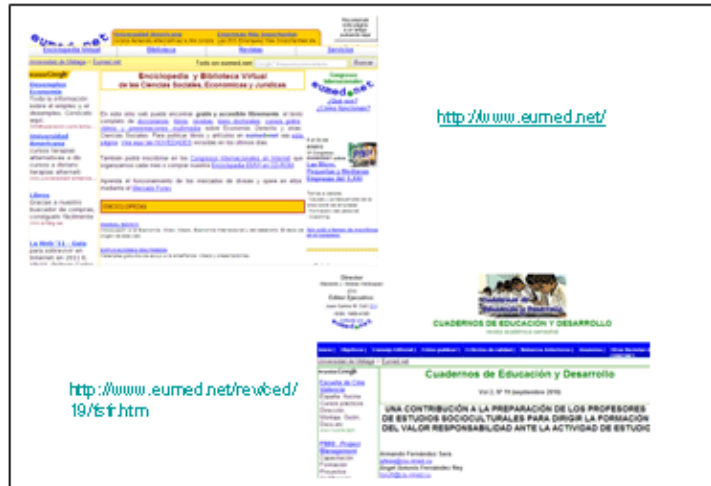
Fig. 3. Enciclopedia y Biblioteca Virtual de las Ciencias Sociales, Económicas y Jurídicas de la Universidad de Málaga, España.

http://www.eumed.net/ y http://www.eumed.net/rev/ced/index.htm