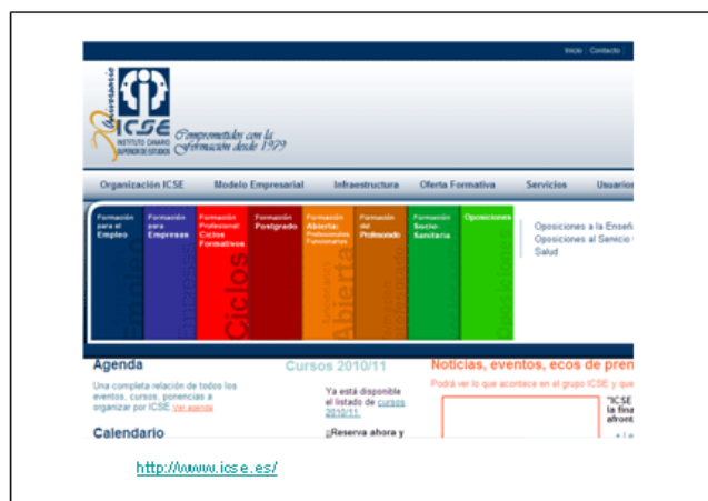
Fig. 2. Instituto Canario Superior de Estudios (ICSE).