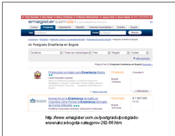
Fig. 5. emagister.com

http://www.emagister.com.co/postgrado/postgrado-ensenanza-bogota-categprov-292-66.htm