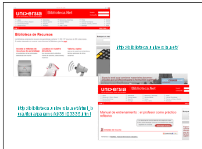
Fig. 4. Biblioteca Universia.

http://biblioteca.universia.net/html_bura/ficha/params/id/38103335.html