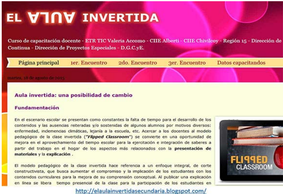
Fig. 2. Aula invertida. Blogspot.

http://elaulainvertidasecundaria.blogspot.com/