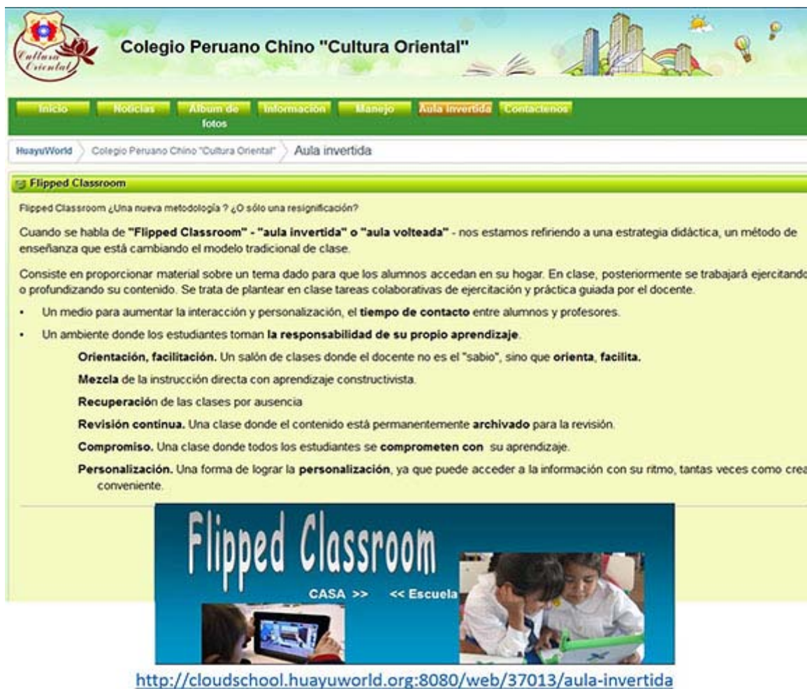
Fig. 3. Colegio Peruano Chino "Cultura Oriental".

http://cloudschool.huayuworld.org:8080/web/37013/aula-invertida