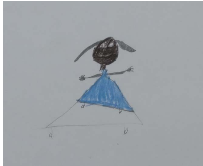
Fig. 1. Dibujo espontáneo.