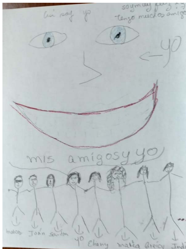
Fig. 2. Dibujo temático de la familia.