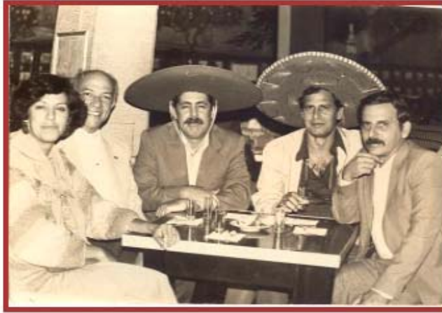
Fig. 2. 1988, participación en Congreso de la Federación Odontológica Latinoamericana, México.