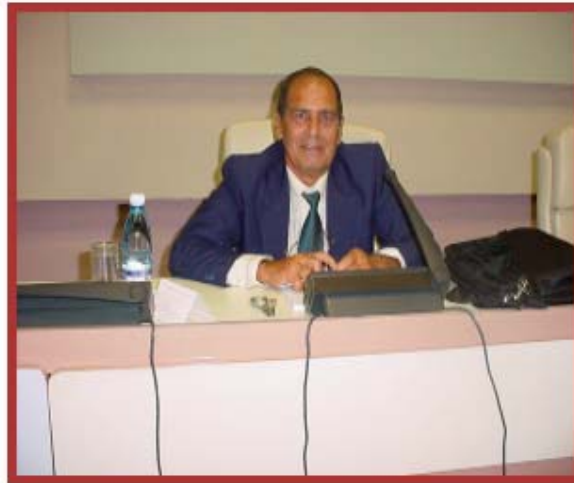
Fig. 3. En Congreso Internacional de Estomatología, Cuba 2005.

Dentro de la Sociedad Cubana de Estomatología, desempeñó diferentes obligaciones al fungir como secretario durante 17 años (1970-1987) y como vicepresidente durante 2 años (1988-1989) llegando a ser nombrado miembro titular de esta sociedad. También prestó su colaboración con otras sociedades científicas internacionales siendo secretario de La Federación Odontológica Latinoamericana FOLA, desde el 1989 al 1991, miembro de la dirección de la misma sociedad desde 1991 al 1993 y miembro del consejo científico de la Facultad de Estomatología de La Habana durante muchos años. Por su destacada labor fue reconocido como miembro de honor de la Sociedad Española de Estomatología Preventiva y Comunitaria. 1,2