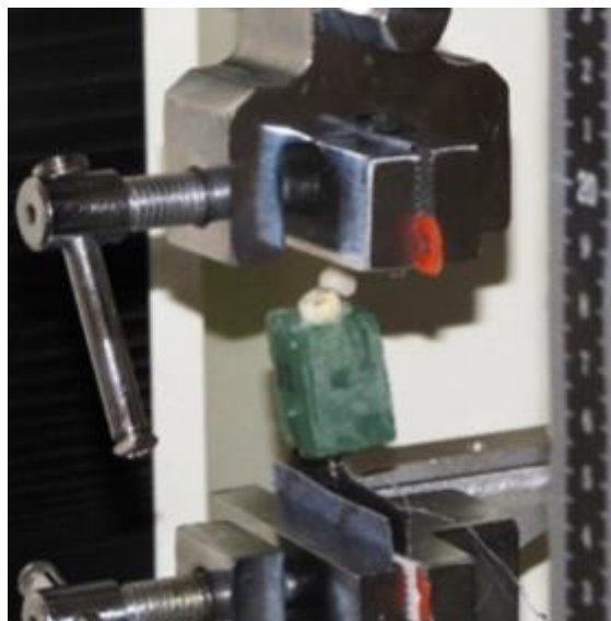
Fig. 2 - Falla de adhesión a la tracción de una muestra acondicionada a una máquina universal de ensayos.

Los cuerpos de prueba fueron sometidos a 500 ciclos de termociclado a 5 °C-55 °C ( \pm 2 °C), el tiempo de inmersión fue de 15 segundos. Luego, los mismos fueron almacenados en agua destilada a 37 °C por 7 días, hasta ser sometidos al ensayo de resistencia a la tracción. Finalmente, los cuerpos de prueba fueron perforados en sus bases para permitir la colocación de un alambre de Cr-Ni de 0,90 mm (55.01.090, Morelli, Sorocaba, SP, Brasil) para sujetarlos a la mordaza de la máquina universal de ensayos (LIYI, LY-1066A 13 1202 series). Todos los cuerpos de prueba fueron cargados en una celda con una velocidad de cruceta de tracción de 5 mm/min (Fig. 2). Los valores de falla fueron registrados en megapascales (MPa).