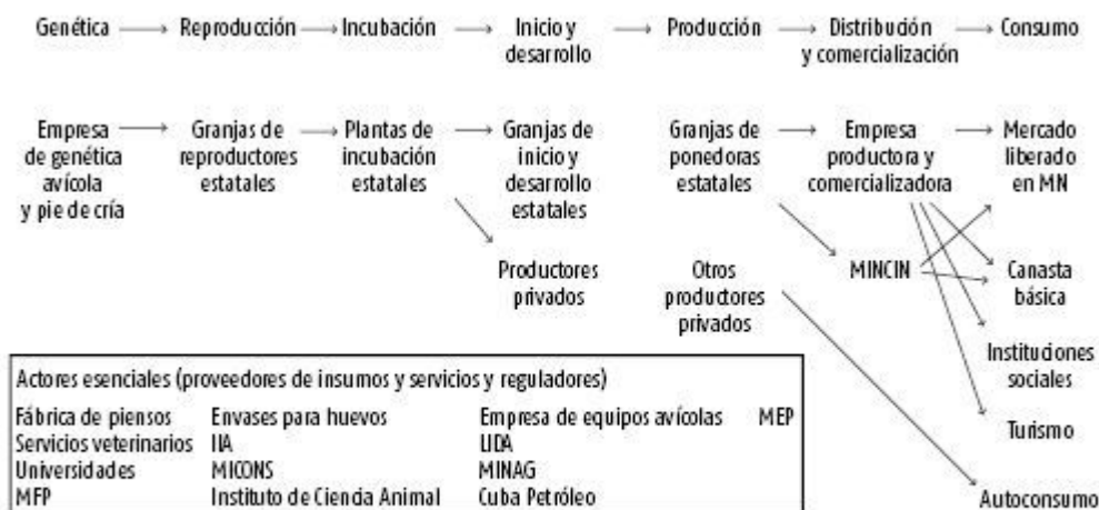
Figura 1. Cadena de valor de la producción de huevos en Cuba.

En la figura 2 se muestra la estructura que se propone para la producción de carne de pollos de ceba. En el año 2002 se decidió dejar de producir este rubro y bajo las condiciones actuales se evalúa la posibilidad de recuperar esta línea.