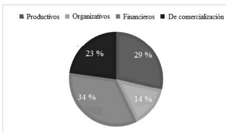
Figura 2. Principales problemas que enfrentan los entrevistados del mercado local del MVM.

Sin embargo, como se sabe en las empresas, por lo regular, se presentan distintas problemáticas que los productores deben solventar, para el caso de este sector la principal es la falta de recursos económicos para liquidar las producciones, debido a que no existen fuentes de financiamiento formales para el capital semilla que requieren para iniciar su actividad y las que existen son muy costosas; entonces, básicamente se van fondeando y refinanciando sin generar una utilidad rentable para ir acumulando un capital (Figura 2).