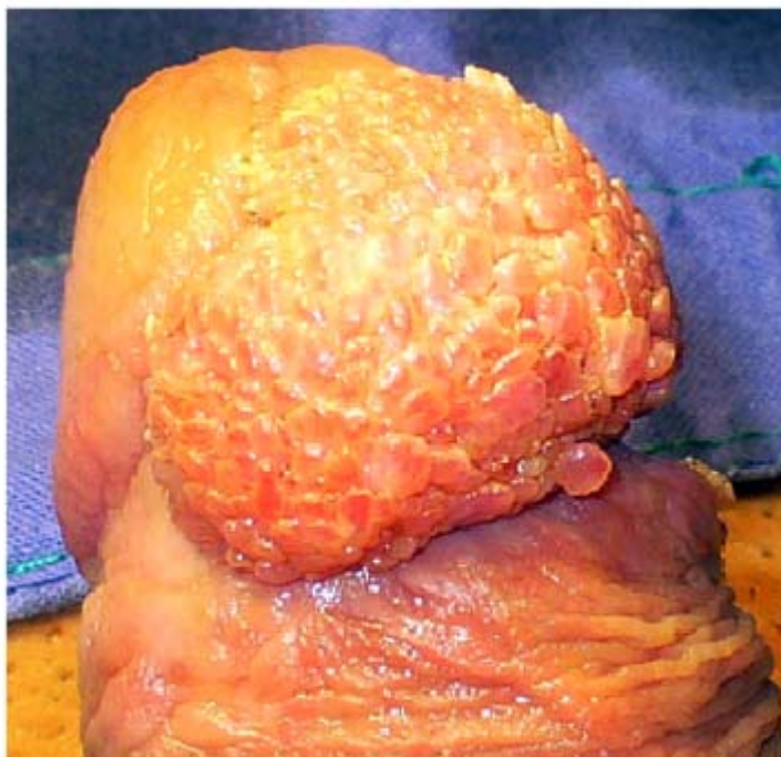
Fig. 1. Condiloma acuminado gigante del pene localizado en la parte ventral del glande.

Al examen físico se constató la presencia de un tumor de aproximadamente 3 cm de diámetro, con aspecto de coliflor, con secreción amarillenta espesa, localizado en la región ventral del pene, y que abarcaba el surco balano-prepucial y la región del frenillo (figura 1).