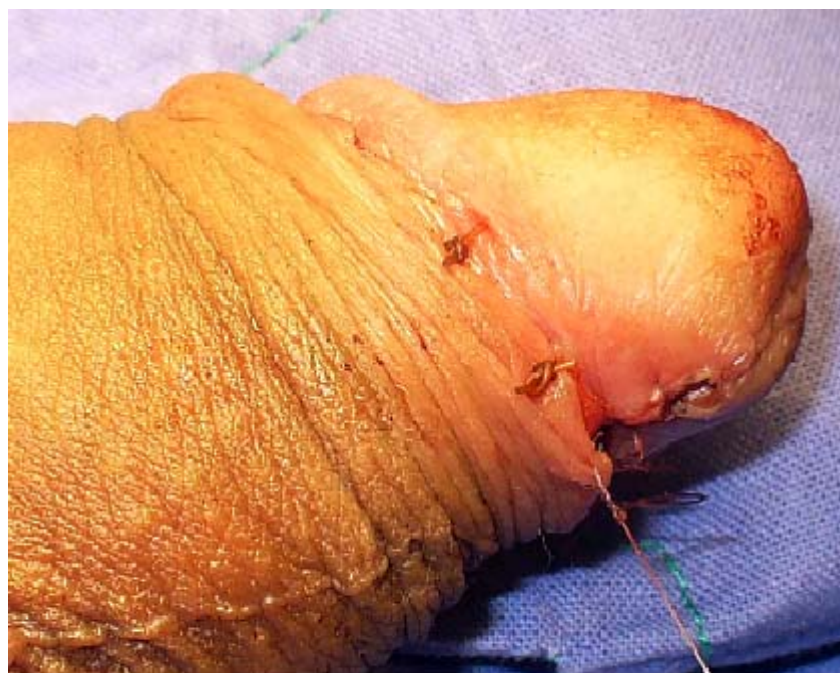
Fig. 2. Remoción total de la lesión más la circuncisión.

Una vez confirmada la naturaleza de la tumoración, se decidió llevar al paciente al salón de operaciones para la exéresis total de la misma más la circuncisión, se obtuvieron buenos resultados estéticos finales (figura 2).