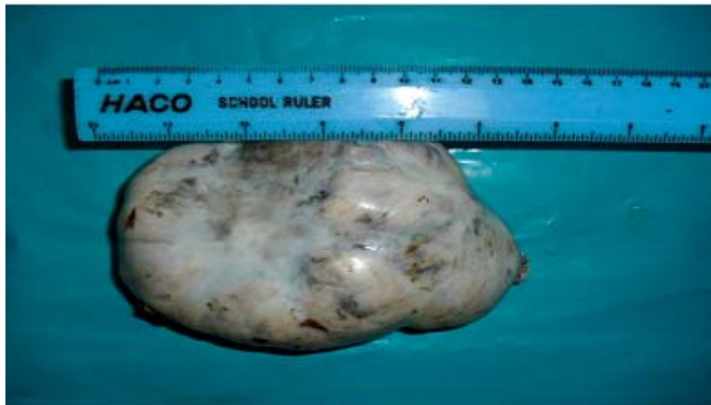
Fig. 2. Tumor en Anatomía Patológica.