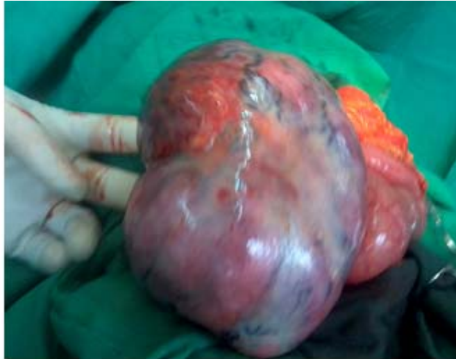
Fig. 1. Vista del tumor durante el acto quirúrgico.