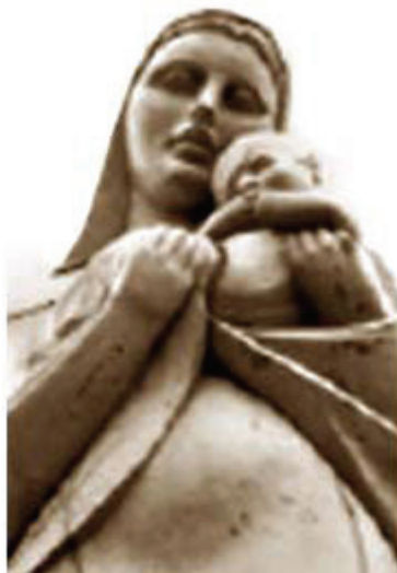
Fig. 3. Escultura en el frente de la fachada del hospital.

Todo ello le ha permitido acumular una valiosa experiencia profesional en la asistencia, la docencia y la investigación científica y un sentido de responsabilidad médica y de compromiso moral con la salud y la felicidad de la población de los tres extensos municipios que atiende y sentido de pertenencia a la institución por parte de su personal profesional, técnico y auxiliar.