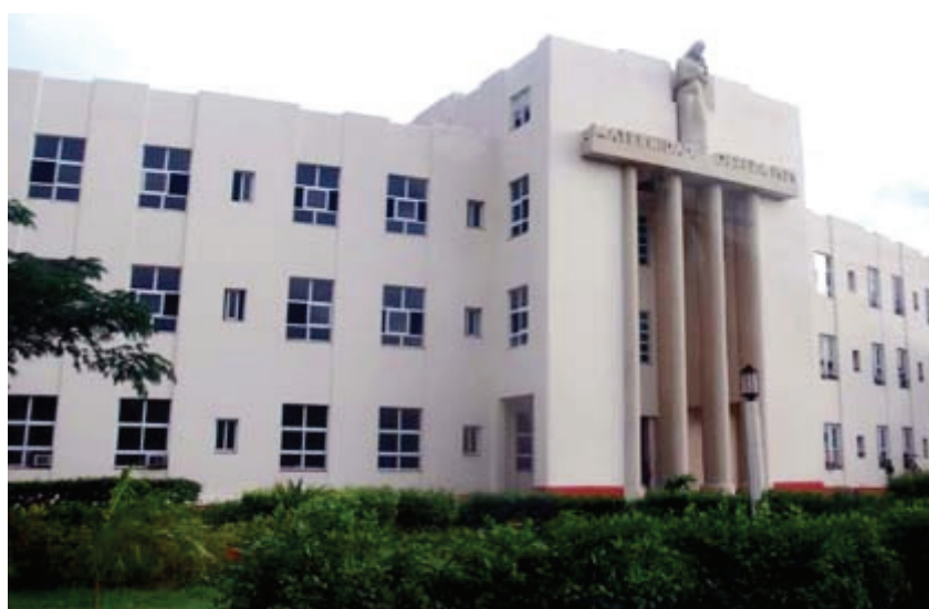
Fig. 1. Hospital Universitario Ginecobstétrico Profesor Eusebio Hernández.