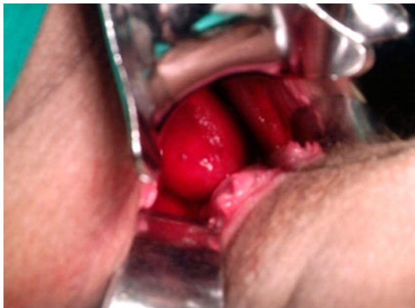
Fig. 1. Fondo del útero que ocupa vagina y protruye a través del orificio cervical externo.