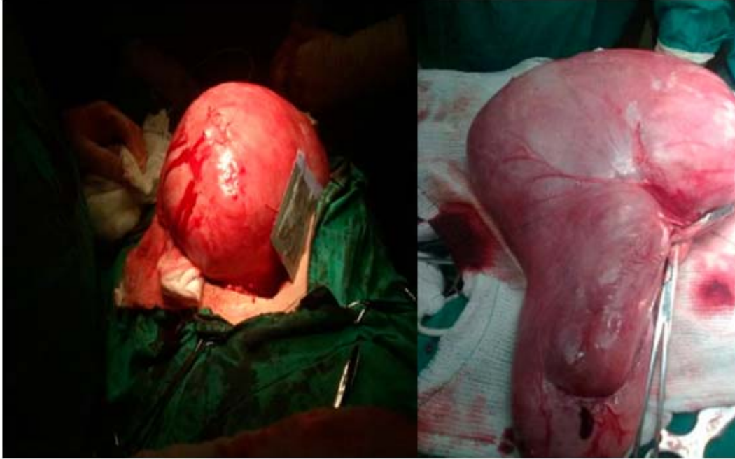
Fig. 2. A la izquierda, imagen intraoperatoria de gran tumor retroperitoneal, previo a su exéresis completa. A la derecha, pieza quirúrgica observándose tumor gigante polilobulado y liso.

Se decidió intervenir quirúrgicamente, realizándose laparotomía exploradora. Como hallazgo se encontró un tumor retroperitoneal que creció por detrás del mesocolon izquierdo, sólido, polilobulado, superficie lisa, que desplazó el útero y anejo izquierdo hacia la derecha, en ambos ovarios de características normales, sin compromiso de uréter izquierdo, ni vasos del retroperitoneo. No otras lesiones en peritoneo, ni órganos intraabdominales. Se realizó exéresis sin complicaciones intraoperatorias, con pérdidas hemáticas de menos de 100 mL (Fig. 2).