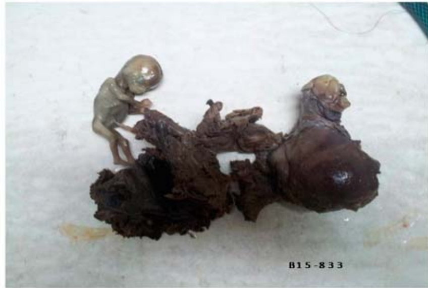
Fig. 4. Útero, anejo izquierdo, placenta y feto. Departamento de Anatomía Patológica, hospital Eusebio Hernández. (B15-833)

La evolución posquirúrgica de la paciente fue satisfactoria y se egresó 5 días después.