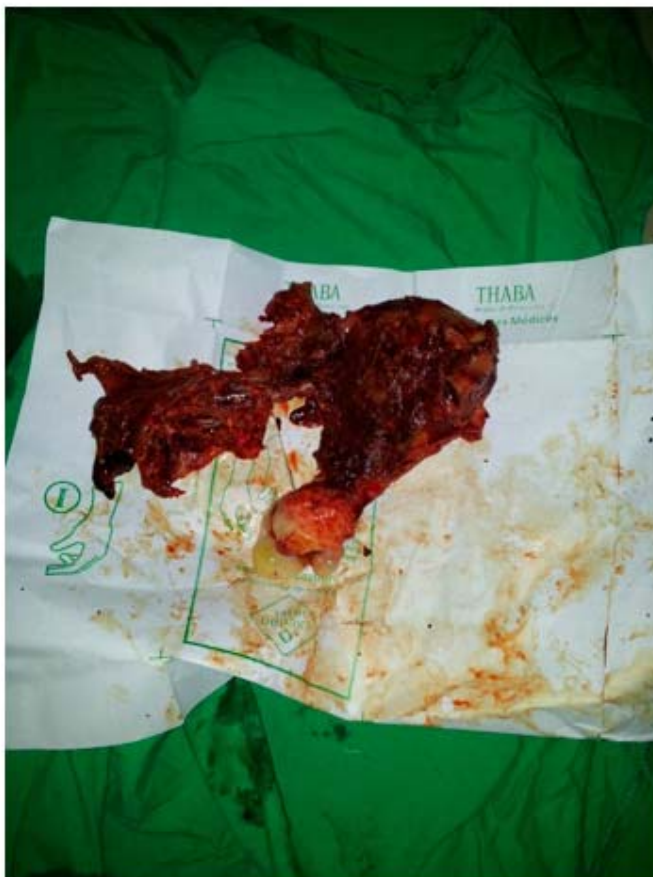
Fig. 3. Cara posterior del útero y anejo izquierdo. Unidad quirúrgica, hospital Eusebio Hernández.

El informe anatomopatológico reporta un embarazo ectópico de 15 semanas, útero con cara posterior anfractuosa y anejo izquierdo con su anatomía muy afectada (Figura 4).