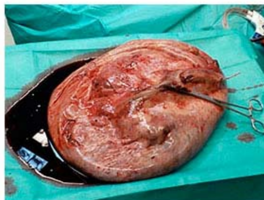
Fig. 3. Aspecto de la tumoración tras el drenaje del contenido líquido y exéresis

Tres semanas después del parto se procedió a la intervención mediante laparoscopia para exéresis de la masa. Para ello se utilizó: trocar único de un solo puerto y dos trócares accesorios de 5 mm en ambos flancos. Tras la apertura de una incisión de 5 cm se objetivó que la pared del quiste se encontraba firmemente adherida al peritoneo; por lo que se hizo una disección digital y se colocó el sistema de puerto único anteriormente mencionado. Posteriormente, se introdujo 16 mmHg de neumoperitoneo y los dos trócares accesorios de 5 mm en ambos flancos para liberar el resto del quiste de manera roma con la ayuda de pinzas atraumáticas y el sistema de aspiración. Una vez liberado del retroperitoneo y del omento mayor, se confirmó que la tumoración quística era dependiente del ovario izquierdo; por lo que se decidió realizar una perforación controlada del quiste aspirando hasta 10 litros de líquido de aspecto serohemático de su interior, lo que permitió reducir su tamaño y su posterior exéresis (Fig. 3). Tras el vaciamiento y extracción de la masa se realizó salpingo-ooforectomía izquierda reglada por la incisión de 5 cm del puerto único y se realizaron abundantes lavados de la cavidad abdominal. La paciente evolucionó de forma favorable siendo dada de alta tres días después de la intervención. La citología tomada durante la intervención fue negativa para malignidad. La anatomía patológica definitiva fue de tumoración multiquística mucosa de ovario con amplio componente necrótico.