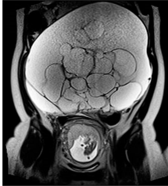
Fig. 1. RMN en la semana 16 de gestación, en la que se ve la formación quística y el producto de la gestación

finos en su interior y que sugería el diagnóstico radiológico de linfangioma quístico o quiste mesentérico. Los marcadores tumorales fueron CEA de 1,1 ng/mL (0-3), CA-15,3 de 13,6 U/mL (0-31,3), CA-125 de 240,8 U/mL (0-35) y CA-19,9 de 12,4 U/mL (0-35).