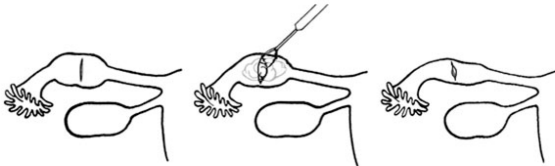
Fig. 1. Corte transversal.