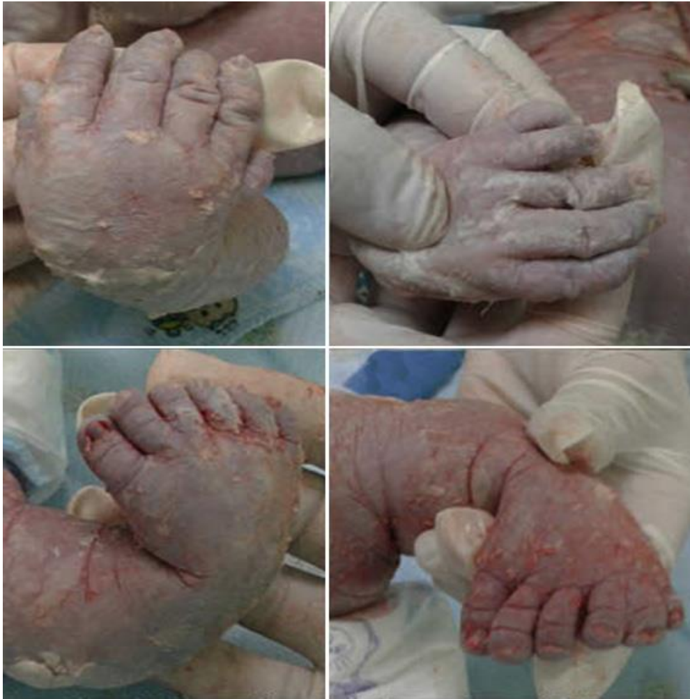
Fig. 2. Extremidades superiores e inferiores con presencia de polidactilia.

El estudio posmortem de Tomografía Axial Computarizado (TAC) simple y de reconstrucciones tridimensionales, mostró: