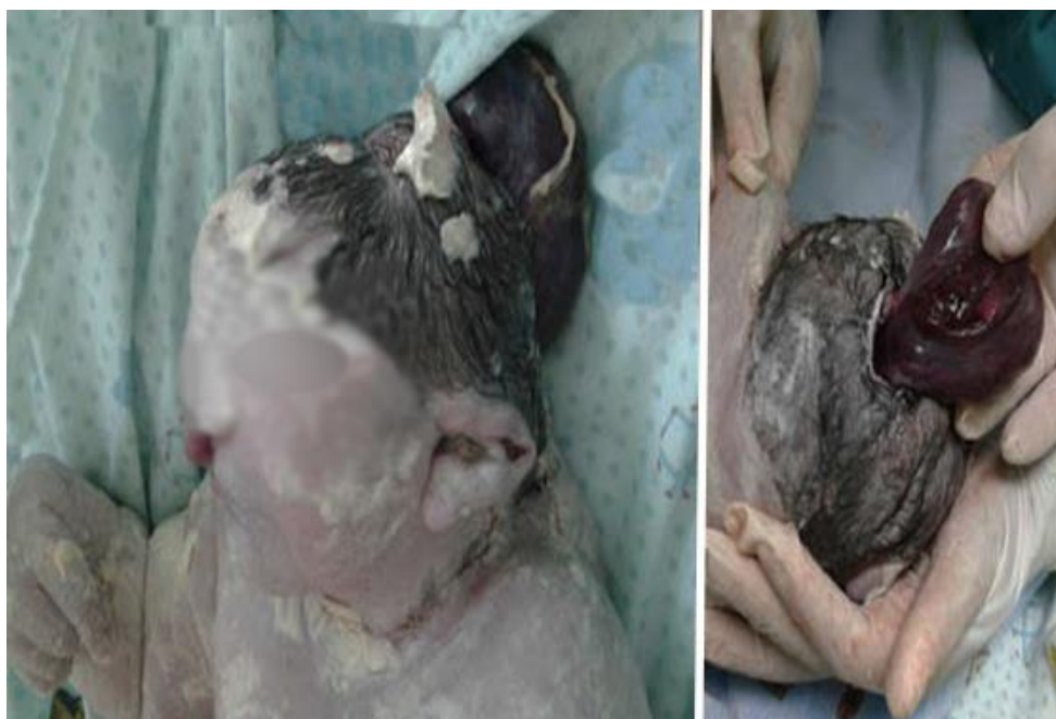
Fig. 1. Cabeza que muestra dimorfismo y aplanamiento de la bóveda craneal, encefalocele occipital con ruptura del saco herniario y salida del contenido que sugiere tejido cerebral rudimentario.