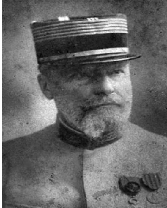
Fig. 2. Foto del Profesor Adolphe Pinard en traje de oficial del ejército francés que dedicó al Profesor Eusebio Hernández Pérez.