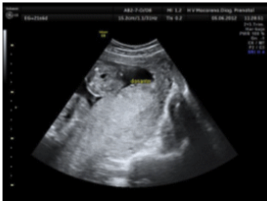
Fig. 3. Imagen ecográfica del feto donante tras cirugía. Vejiga visible y líquido amniótico normal

La gestante continuó el control en su Hospital de origen, sin incidencias a destacar. En la semana 32, consultó en el Servicio de Urgencias por metrorragia, malestar general y fiebre, donde se comprobaron desaceleraciones precoces en el primer feto. No se mostraron alteraciones en la exploración ecográfica, aunque en la especuloscopia llamó la atención la presencia de la bolsa amniótica del primer gemelo en vagina. Se realizó una amnioscopia, que se describió como líquido amniótico teñido, por lo que la paciente ingresó para la finalización del parto tras maduración pulmonar.