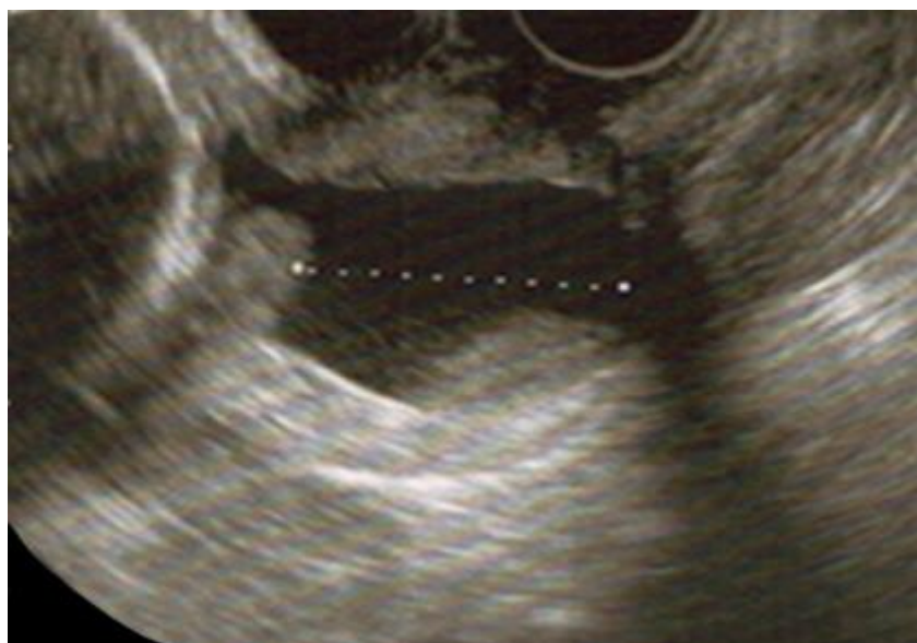
Fig. 2 - Imagen de cérvix por ecografía transvaginal a las 22 semanas.