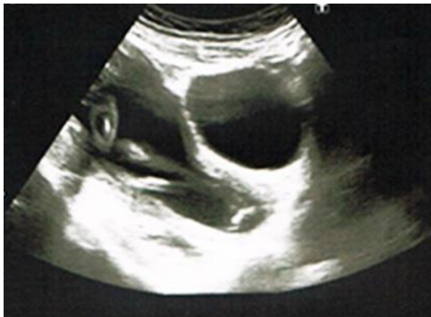
Fig. 1 - Imagen de cérvix por ecografía transabdominal al ingreso (20,6 semanas).