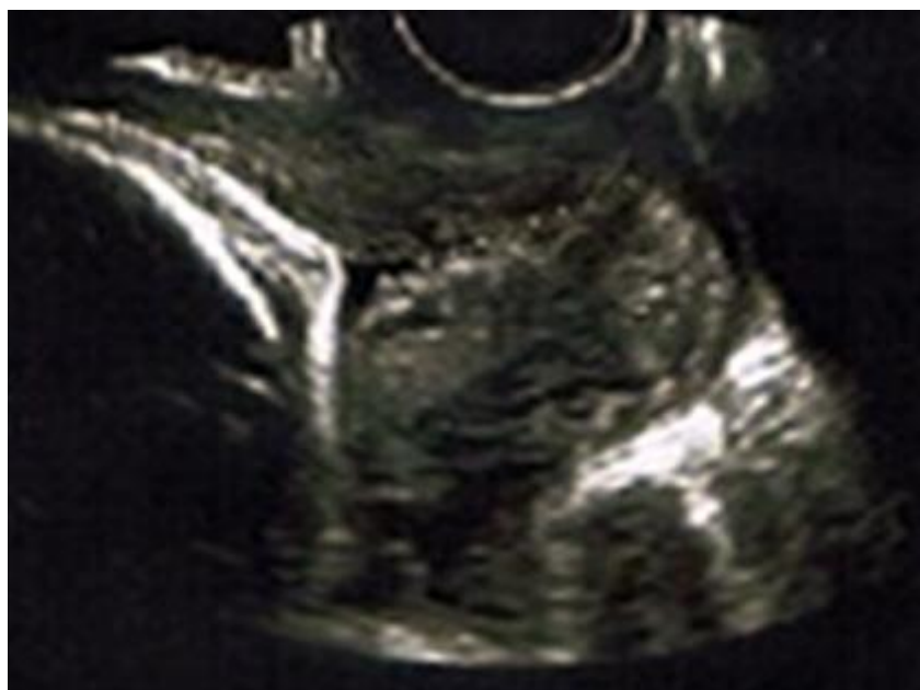
Fig. 4 - Imagen de cérvix por ecografía transvaginal a las 28 semanas.