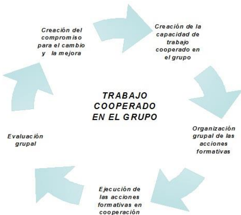
Figura -3 Recurso metodológico para el trabajo cooperado en el grupo de docentes universitarios.

Se determinó grupalmente la ejecución de acciones formativas que combinaron armoniosamente formas de la superación profesional y el trabajo docente-metodológico, instrumentadas desde una metodología participativa, a través del trabajo cooperado en el grupo de docentes, recurso que no solo facilita la apropiación de contenidos teórico-prácticos y el desarrollo personal, sino la producción de situaciones de aprendizaje y condiciones transferibles a los grupos de clase, en palabras de Stigliano y Gentile 15 : “como un puente entre una buena enseñanza y muchos aprendizajes duraderos”.