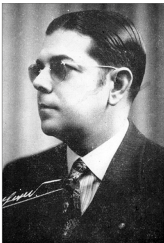
Fig. 22. Dr. Guarino Radillo García (1900 - ?)

No obstante todas estas limitaciones, el entusiasmo de algunos de sus profesores permitió realizar algunas investigaciones, aunque no despertaron el interés suficiente por esta importante rama de la medicina entre alumnos y graduados, para que un número mayor, del que lo hizo, se iniciara y desarrollara en ella.