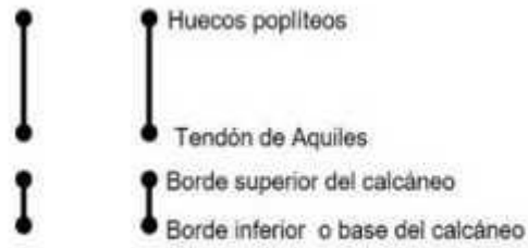
Fig. 4. Esquema alámbrico del talón y la pierna.

En el análisis estadístico se empleó el programa SPSS, se realizó una descripción de las tendencias centrales (medias), de las medidas de dispersión (desviación estándar, rangos, máximos, mínimos). Para determinar el tipo de distribución, se aplicó el test de Kolmogorov-Smirnov (Lilliefors) , obteniendo valores de distribución no normal, aplicándose tests no paramétricos; el de Mann-Whitney , para la constatación de las variables halladas en la marcha atlética y el coeficiente de correlación de Pearson, para correlacionar los parámetros analizados.