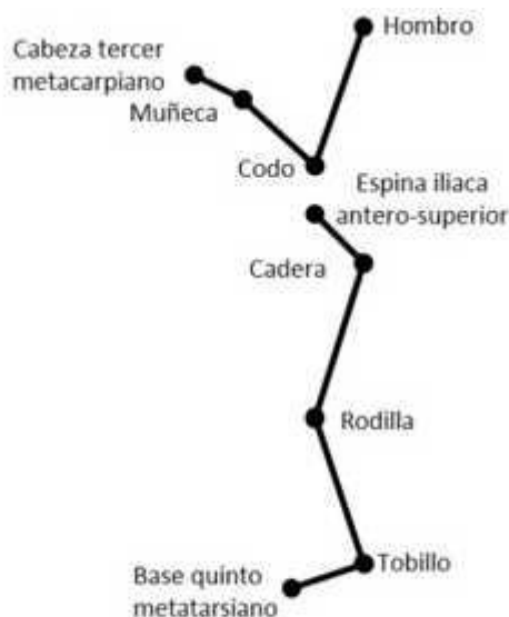
Fig. 3. Esquema alámbrico de las extremidades superiores e inferiores.

Previamente, se filmó el calibrador de 1 000 × 1 000 mm, por donde pasaría el marchista, se digitalizaba su imagen (planos frontal anterior y sagital). Para obtener valores de referencia, se grababa al sujeto 10 s, en posición anatómica natural, en el sitio donde se filmó el calibrador.