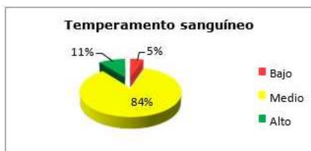
Fig. 1. Temperamento sanguíneo.

La primera etapa de la investigación incluye la evaluación del tipo de temperamento predominante en el grupo. Una vez entrenados los alumnos en la metodología que exige el test anteriormente citado, se procede a su aplicación y tabulación de los resultados obtenidos, los cuales se muestran a continuación. Como puede apreciarse el 84 % de los estudiantes llegan a manifestar un nivel medio del temperamento sanguíneo, mientras que el 11 % presenta un nivel alto y el 5 % un nivel bajo ( Fig. 1 ).