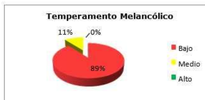
Fig. 4. Temperamento melancólico.

En la Estadística descriptiva, se evaluó la media y la desviación standard, entre otros valores de la variable estudiada (tipo de temperamento), los cuales se recogen en la tabla .