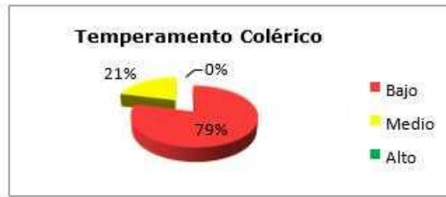
Fig. 2. Temperamento colérico.