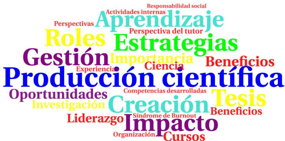
Fig. 2. Principales temáticas encontradas en las fuentes de información.

Las temáticas de las publicaciones estuvieron relacionadas con mayor frecuencia a la producción científica (13,7 %), la Sociedad Científica Estudiantil como una estrategia (11,8 %) y a la creación de la sociedad (7,8 %) (Fig. 2).