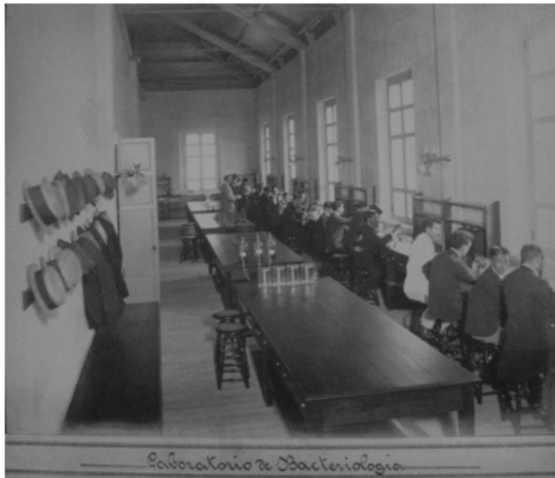
Fig. 3. Unidad documental simple.

FOTOGRAFÍAS QUE CONTIENEN EN LA PARTE INFERIOR LA IDENTIFICACIÓN DE LA IMAGEN (Fig. 3)