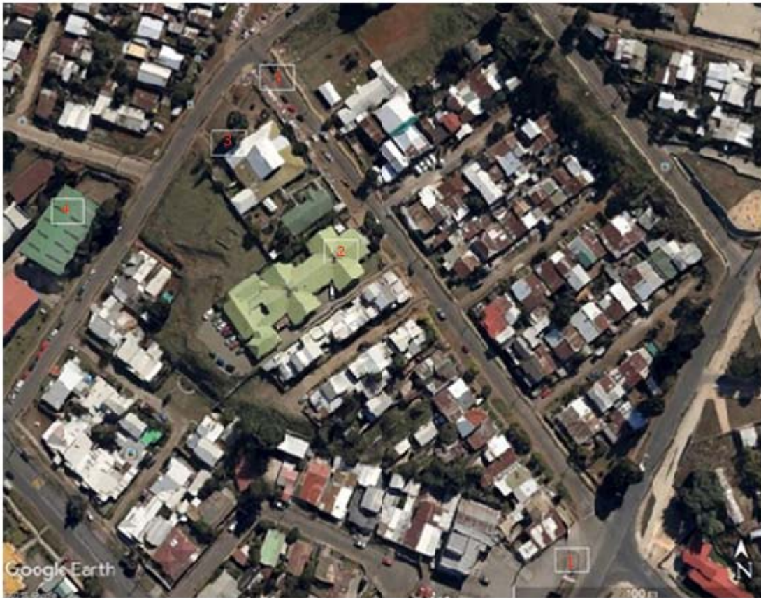
Fig. 3. Imagen satelital del área de interés: 1) empresa de almacenamiento y distribución de carnes; 2) el centro de atención primaria de salud; 3) jardín infantil; 4) colegio y 5) comercio informal en las veredas, obtenida con el uso de Google Earth ©.

Así también, las coordenadas reales de un objeto de interés versus las reportadas por la plataforma suelen estar desplazadas varios metros. Por último, una evaluación presencial experta en terreno siempre tendrá mejores resultados (Fig. 3).