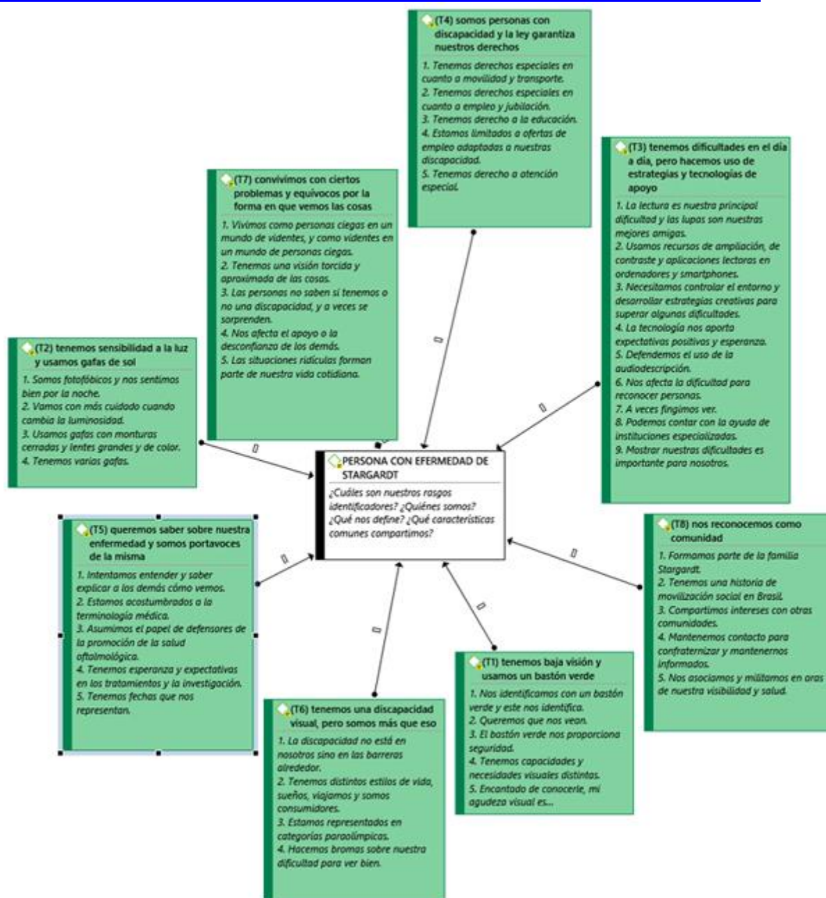
Fig. 2 - Rasgos identificadores de la persona con enfermedad de Stargardt.

Los tres primeros rasgos asocian la identidad de la persona con esta enfermedad a objetos que han sido incorporados a su rutina: el bastón, las gafas de sol y las tecnologías de apoyo. Los rasgos T4 y T5 representan el aspecto social recogido en la legislación y el papel de portavoces en la construcción social de su identidad. Los rasgos T6 y T7 constituyen aspectos de la vida diaria que los definen más allá de la enfermedad (como estilo de vida), pero vinculados a los problemas y equívocos inherentes a la baja visión. Por último, el rasgo T8 se refiere a la relación entre las personas con enfermedad de Stargardt, mediante su vinculación comunitaria e institucional.