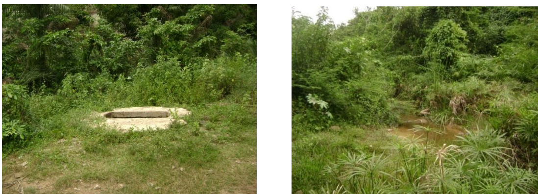
Fig. 1. A) Pozo “Rive Fuente” y B) Pozo “Bárbara”

Las muestras fueron colectadas superficialmente por especialistas (doce muestreos). La toma y conservación de las mismas, se realizó mediante la metodología establecida en el Standard Methods [7, 8]. La temperatura se determinó in situ .