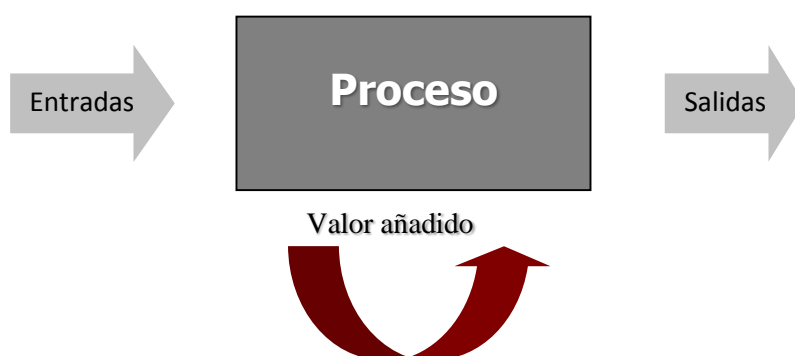
Fig. 1- Definición de proceso.

En todas las definiciones se puede apreciar que en el concepto subyacente siempre está presente el elemento de ordenamiento secuencial de las actividades para producir un resultado previsible y satisfactorio. Por ello, una definición más abarcadora sería la siguiente: “conjunto de actividades destinadas a generar valor añadido sobre las entradas para conseguir un resultado que satisfaga plenamente los requerimientos del cliente” (Fig. 1). (21)