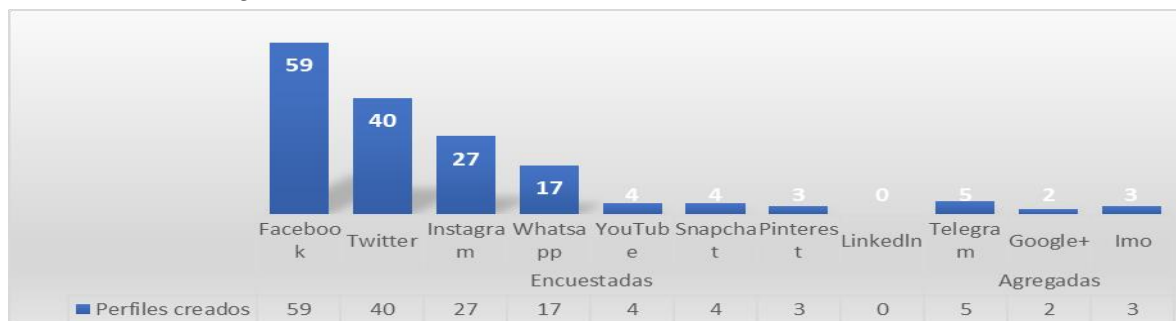
Figura 2. Perfiles habilitados por los usuarios en las redes sociales.

Es lógico que no se encuentre presencia en LinkedIn ya que es una red social profesional, y está orientada más a relaciones comerciales y profesionales que a relaciones personales. Aunque no está en la encuesta otro tipo de red social que no es común que los estudiantes utilicen es ResearchGate la cuales utilizada por los científicos para socializar parte de sus artículos antes de ser publicados en las grandes revistas.