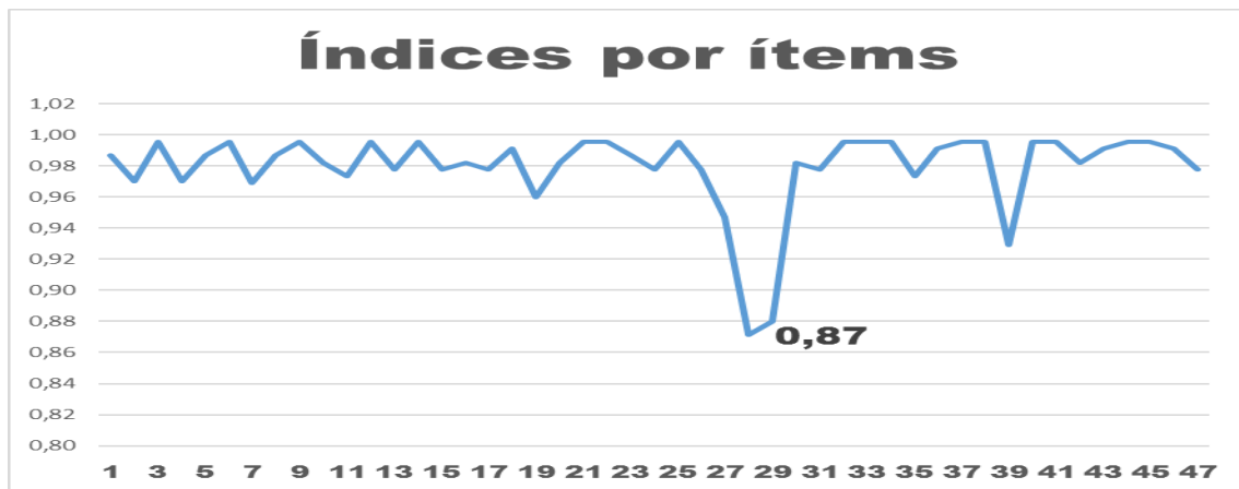
Figura 2. Índice por ítems de la validez de contenido alcanzada por la escala de medición del proceso de afrontamiento y adaptación (ESCAP), de Callista Roy 2004.

La Figura 2 muestra el índice de validez de contenido alcanzado por cada ítem de la escala, donde se observa que los resultados más bajos se obtuvieron en la valoración realizada a los ítems: 28 («Utilizo el sentido del humor para manejar la situación»), correspondiente al factor 5, y al 29 («Con tal de salir del problema o situación estoy dispuesto a cambiar mi vida radicalmente»), correspondiente al factor 1. En este caso ambos obtienen valores superiores a 0,80, lo que representa una valoración de suficiente de acuerdo con los criterios Moriyama. El ítem 28 alcanzó un índice de valoración de 0,87, y el 29 de 0,88.