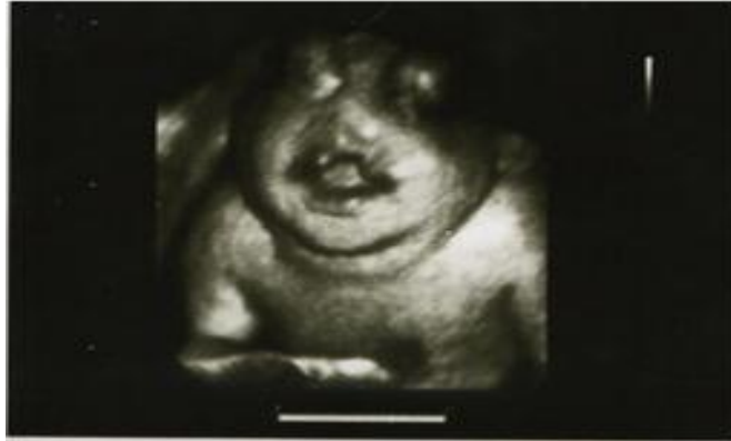
Figura 1. Imagen ultrasonográfica en 3D, donde se observa feto con ausencia de huesos craneales y otras malformaciones asociadas.

Feto anencefálico con otras malformaciones asociadas (Figura 1)