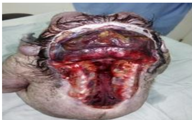
Figura 2. Se observa malformación completa del Sistema Nerviosos Central, con espina bífida, ausencia huesos craneales y anencefalia.

Se decide realizar cesárea de urgencia, se obtiene recién nacido Apgar 0/0, sexo femenino, peso 2 000 gramos, con malformación completa del Sistema Nervioso Central, espina bífida con apertura total de la columna desprovista de piel, ausencia de huesos craneales y hemisferios cerebrales rudimentarios. (Figura 2)