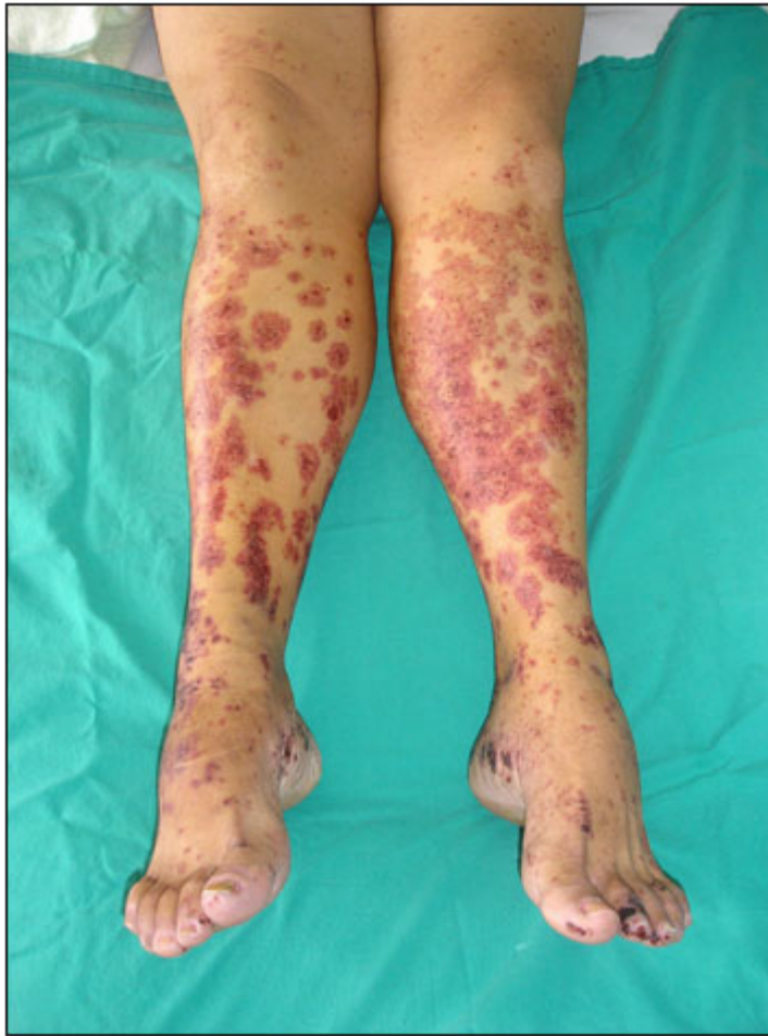
Fig. 1. Lesiones purpúricas en miembros inferiores.