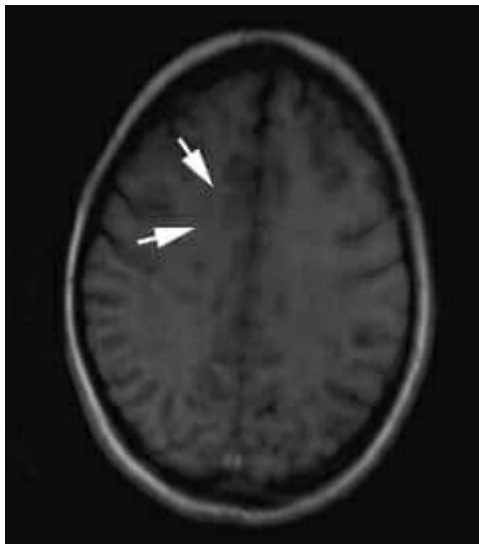
Fig. 1a - Se visualiza en técnica T1 pequeñas lesiones de sustancia blanca de igual localización que las apreciadas con técnica Flair.

Angio TAC de cráneo (26/2/2018): Se realiza con reconstrucciones MPR, MIP y AVA administrándose 120cc de contraste hidrosoluble, observándose múltiples imágenes de defecto de lleno en el interior de la vena de galeno, seno recto y prensa de Herófilo en relación con trombosis de senos derales, trombo en la vena cerebral interna derecha que producen irregularidad de la luz, red de finos vasos de tipo venoso localizados en la sustancia blanca del lóbulo frontal izquierdo, los cuales drenan en una gruesa vena colectora de 2,6 mm de diámetro, la cual se labra a través de la sustancia blanca drenando en la vena