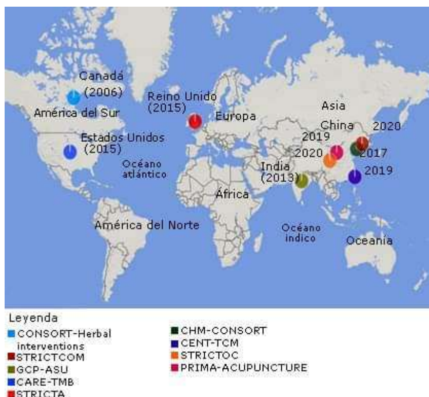
Fig. 2 - Distribución de instrumentos de evaluación de la calidad en MNC en el mundo.

La consulta a las bases de datos permitió identificar la distribución del uso de 9 de los 12 instrumentos; una guía clínica y las demás listas de verificación de la red EQUATOR (Fig. 2).