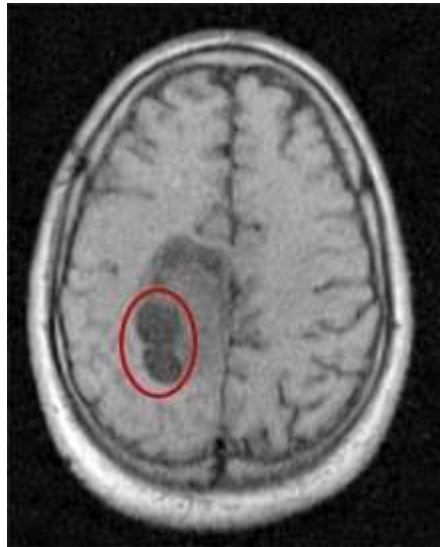
Fig. 3 - Necrosis tumoral secundaria al tratamiento radiante.

Se mantiene con Nimotuzumab. Cuatro meses después comienza a presentar signos de hipertensión endocraneáa por edema cerebral con deterioro de las funciones neurológica por lo que es reintervenido quirúrgicamente para derivación. Es dado de alta hospitalaria con hemiplejía total y completa del lado derecho. Dos meses comienza nuevamente con deterioro marcado de las funciones neurológicas y fallece en junio de 2018.