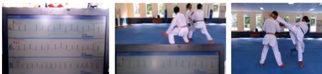
Monitor de computadora portátil, con tres electrocardiogramas en tiempo real, conectada a transmisores ubicados sobre tres karatecas durante entrenamiento.

Mediante el uso del sistema MOVICORDE se pueden recoger datos muy importantes en cada sesión en que se aplique, como son: frecuencia cardíaca inicial, pulso de entrenamiento y sus límites, segmentos electrocardiográficos, duración y zonas de trabajo según frecuencia cardíaca, asociados todos estos elementos al tiempo real de la actividad deportiva que se realiza, medidos y registrados segundo a segundo, sin que medie interacción personal (fig. 3).