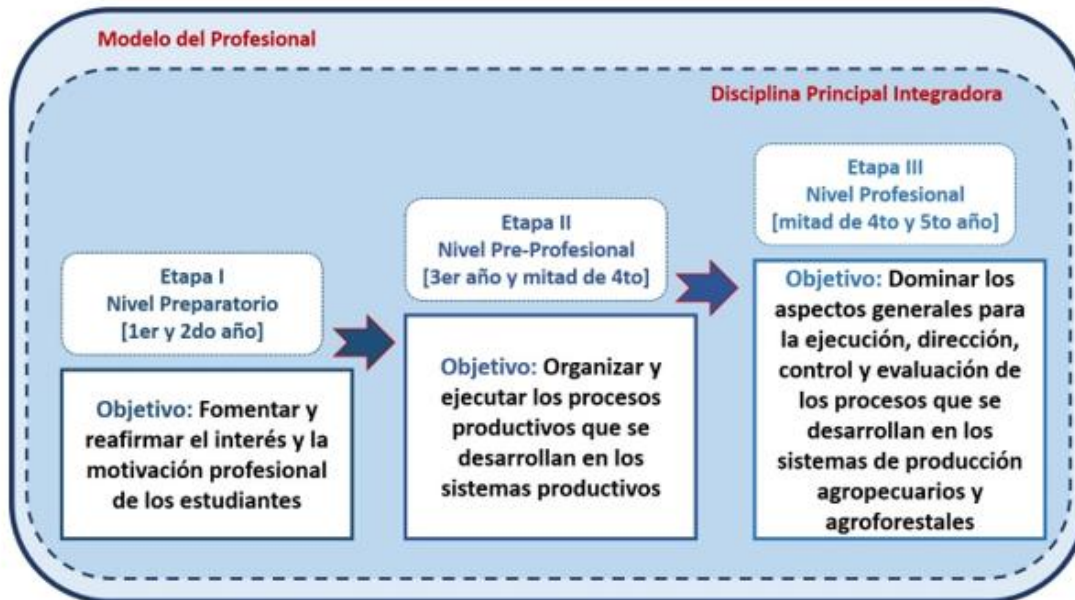
Fig. 1. Representación de los niveles en que se divide la formación del ingeniero agrónomo.