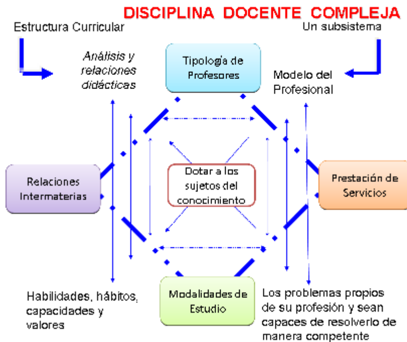
Fig. 1. La Disciplina Docente Compleja.

Además pueden presentar otra característica: Sea una disciplina básica o básica específica de la carrera.