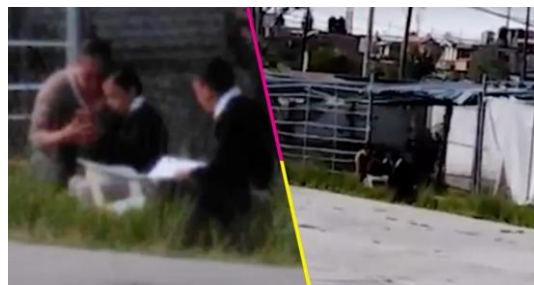
Fig. 3 - Familia toma clases en una cancha para tener acceso a internet gratuito en Puebla.

Las experiencias de las estudiantes, los relatos que fueron centrales para esta investigación, muestran aspectos de la vida cotidiana de estudiantes que son parte de su formación y que por las circunstancias pueden hacer de su tránsito por una institución educativa un camino sinuoso y que les puede representar en ocasiones la deserción o rezago. El contar con las herramientas necesarias para estudiar: libros, cuadernos, computadora, Internet, etcétera, son clave para el éxito o fracaso de un estudiante. En México, el acceso a internet en un contexto pandémico y de confinamiento como el que vivimos, es primordial y no es una necesidad que muchas familias mexicanas puedan cumplir. En el Estado de Puebla, en México (figura 3) una madre lleva a sus hijos a un parque público para poder acceder al internet gratuito del lugar y que sus hijos puedan estudiar.