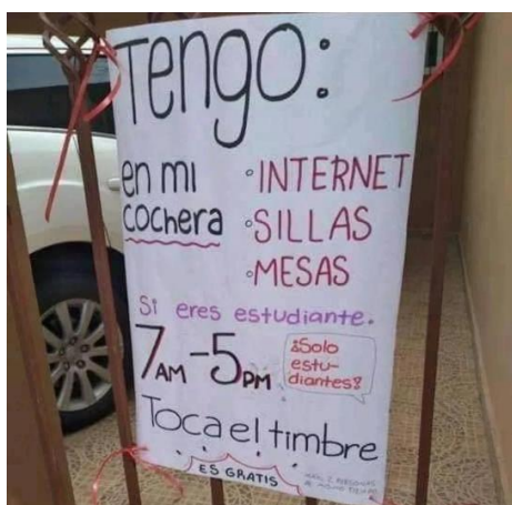
Fig. 2- Internet gratis en Bochil, Chiapas

condiciones socioeconómicas es una generalidad, la cual no parece tener solución a corto plazo; en contraste, la sociedad en ocasiones y por sectores llega a ponerse de acuerdo (figura 2):