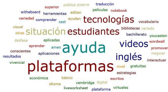
Fig. 6- Nube de palabras sobre las plataformas más empleadas para el aprendizaje del vocabulario