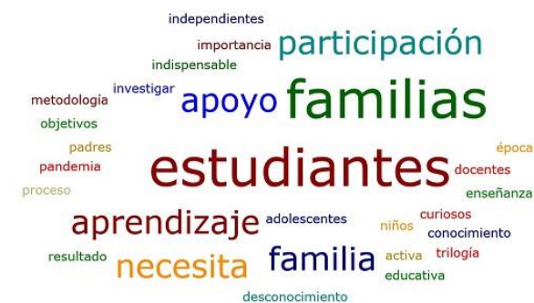
Fig. 3- Nube de palabras sobre la motivación de los estudiantes y apoyo de las familias

Uno de los pilares para el éxito del Aula Invertida es la motivación de los estudiantes y el apoyo de las familias, como se ha indicado anteriormente. En el caso analizado, la totalidad de entrevistados coincidieron en los conceptos clave que se muestran en la siguiente figura.