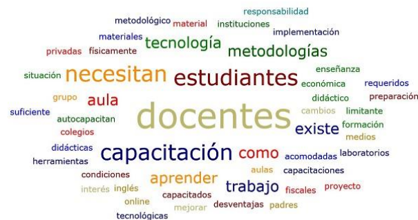
Fig. 2- Nube de palabras sobre condiciones para implementación y capacitación de los docentes

manifestó que sí se encuentra preparado y el otro 50 % lo contrario. Ello indica que este es uno de los aspectos en los que más la Unidad Educativa debe trabajar si se aspira a implementar la metodología de forma generalizada en el octavo grado.