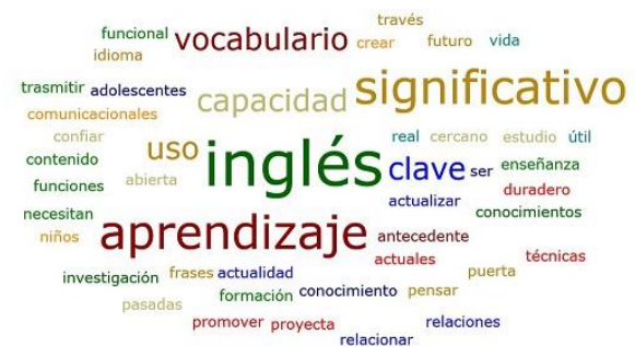
Fig. 5- Nube de palabras sobre el aprendizaje significativo

En relación al aprendizaje significativo que debería lograrse en la clase de inglés, todos los docentes manifestaron estar de acuerdo, destacándose lo que se muestra en la figura 5.