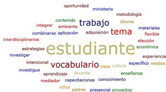
Fig. 1- Nube de palabras sobre utilidad de la metodología

En relación al conocimiento de la metodología y su utilidad en la asignatura de inglés, especialmente para la adquisición de vocabulario, la totalidad de los entrevistados se manifestaron positivamente. En la figura 1 se muestra la nube de conceptos construida en relación con estas primeras preguntas de la entrevista: