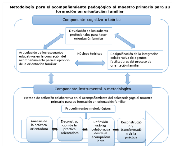
Fig. 1- Estructura interna de la metodología

Para cumplir con su objetivo, la metodología se ajusta a las potencialidades y posibilidades de los sujetos en formación, así como a las condiciones presentes en la escuela como espacio formativo. Los núcleos teóricos que sustentan la metodología son considerados como condiciones pedagógicas para que acontezca ese proceso de formación en los maestros; por eso se manifiestan no solo en la asimilación del conocimiento, sino en el desarrollo de saberes profesionales.