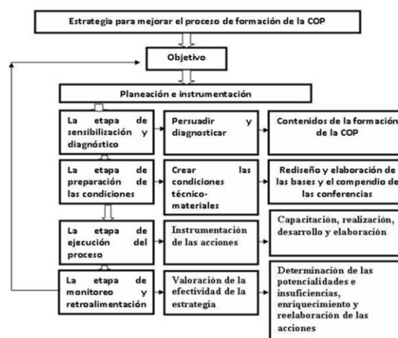
Fig. 2- Representación de la Estrategia de Implementación

La estrategia pedagógica contó con las siguientes etapas: una primera dedicada a la sensibilización y al diagnóstico; una segunda, a la preparación de las condiciones para poder enfrentar las exigencias del proceso que establece el modelo; una tercera, a la ejecución del proceso de formación de la COP y una cuarta, de monitoreo y retroalimentación de los resultados según los objetivos propuestos y el rediseño de las acciones y de la estrategia en general. Su objetivo fue implementar las acciones elaboradas en la práctica pedagógica para el mejoramiento del proceso de formación de la COP, en los estudiantes de la carrera Licenciatura en Educación Informática, de la UPR. Su estructura se grafica en la fig.2.