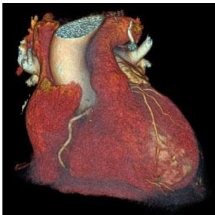
Fig. 1 – Angiotac, muestra las lesiones graves de diagonales y otros vasos de microcirculación coronaria, con remodelación de ventrículo izquierdo. Las arterias epicárdicas absolutamente normales.

del tromboxano A 2 , y la inhibición de la sintetasa de la prostaciclina, la hipercoagulabilidad, los cambios hormonales en hombres y mujeres, la resistencia a la insulina y el nivel de hemoglobina glicosilada en diabéticos, las variables clínico-epidemiológicas asociadas como factores modificables y no modificables; son conocimientos actuales que hacen de esta entidad algo sistémico e importante. (13) Después de descartarse otras causas, (1,2,3,4,5) se consideró que la insuficiencia renal transitoria ocurrió como fenómeno multicausal raro tras administración de estreptoquinasa. (6,7,8,9,10)