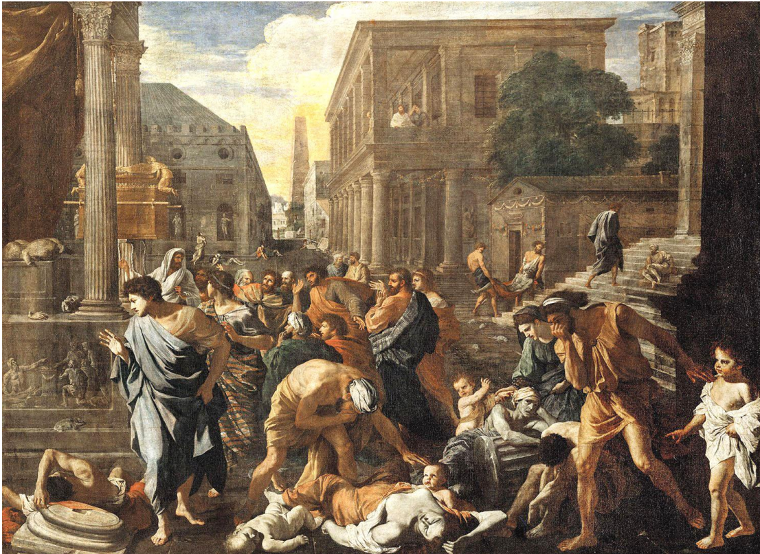
Fig. 1 - La peste de Azoth, de Nicolas Poussin (1594-1665).