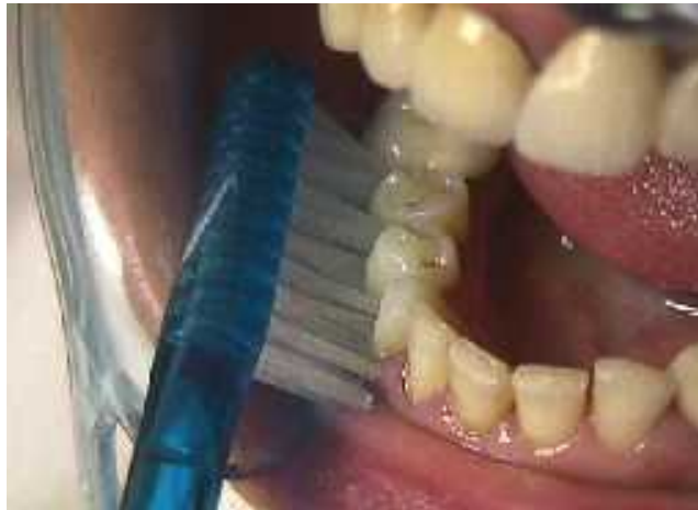
Fig. 2. Técnica de Bass.