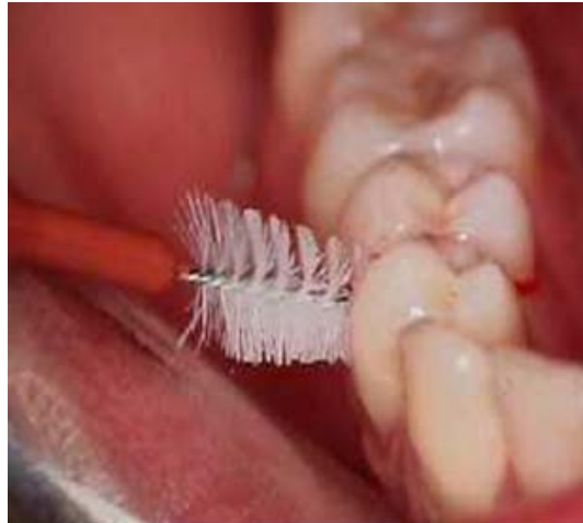
Fig. 5. Cepillos Interdentales.