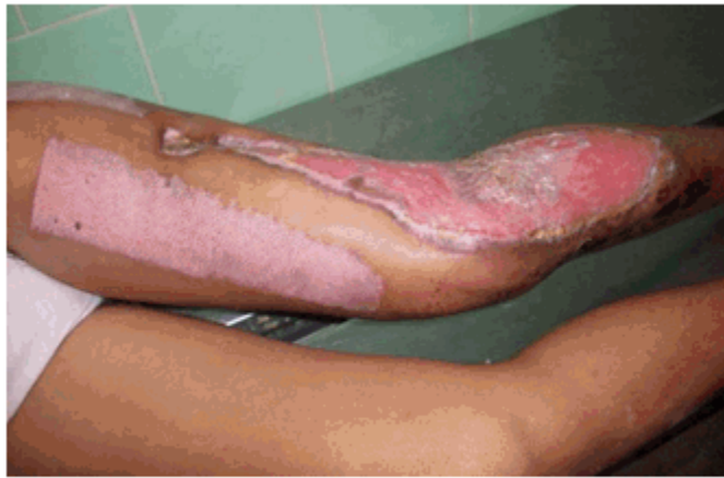
Figura 3 b) Tercera semana de tratamiento