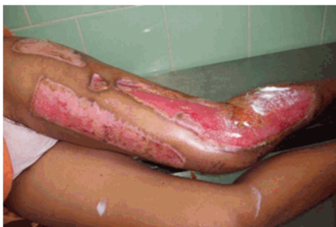
Figura 3 a) Fascitis necrosante de la pierna en fase granulación

necrosado varió entre cuatro y nueve veces. El 90,9 % de los pacientes necesitaron auto u aloinjerto de piel mallada, en dependencia de la extensión del área a injertar. (Figura 3a,b,c)