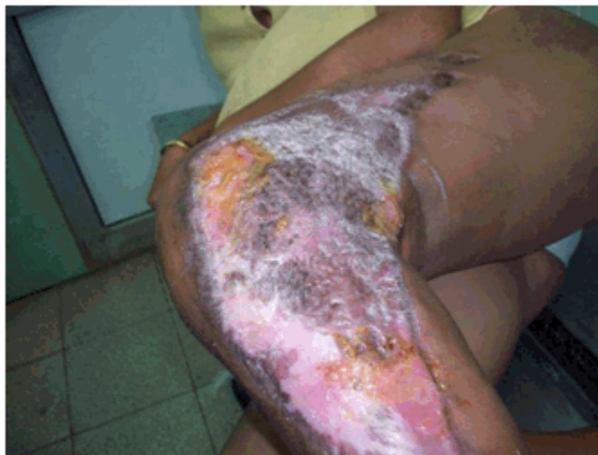
Figura 3 c) Resultado final

La estadía hospitalaria fue de 37 días ( 28,4 \pm 9,1 ) y la mortalidad de 9,09 %, pues solo falleció un paciente a consecuencia de la sepsis severa que provocó fallo multiorgánico.