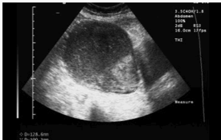
Figura 1. Imagen ecográfica que muestra gran distensión de la cavidad uterina.

A continuación se le practicó una tomografía del abdomen y pelvis, con el hallazgo de una masa