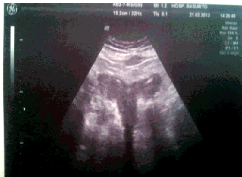
Figura 3. El vaciado parcial de la piometra pone en evidencia un útero bicorne.

que reveló, durante las últimas fases de la evacuación, la existencia de un útero bicorne. (Figura 3).